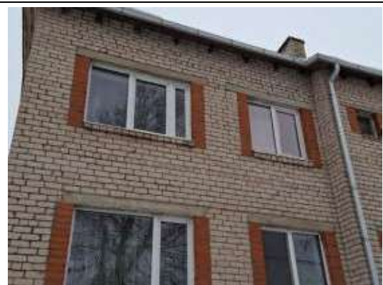
Dzīvokļa Nr.12 logi