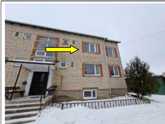
Dzīvokļa Nr.12 logi