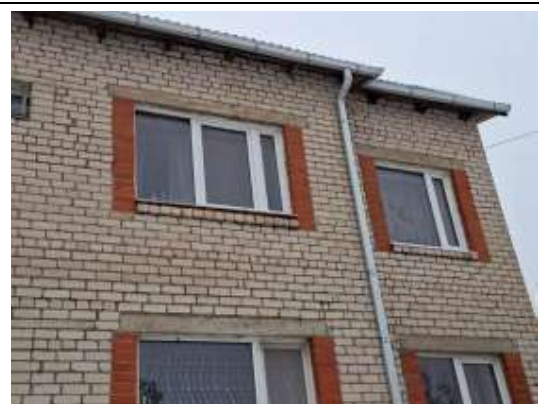
Dzīvokļa Nr.12 logi