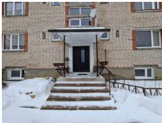
ieeja kāpņu telpā