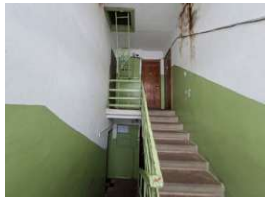
2.stāva kāpņu telpa