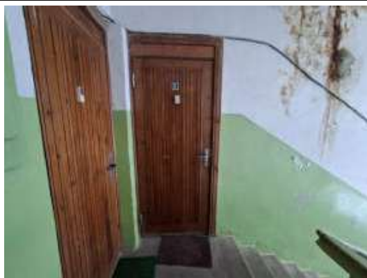
Dzīvokļa Nr.12 ieejas durvis