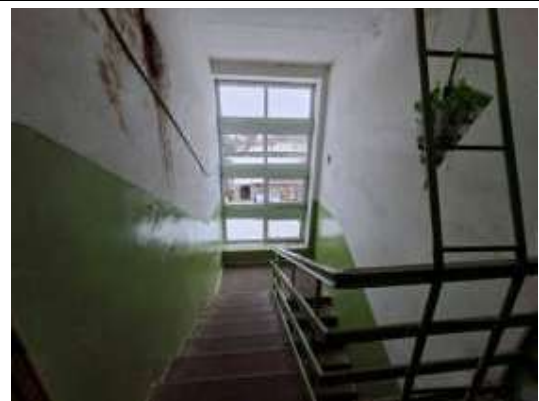
2.stāva kāpņu telpa