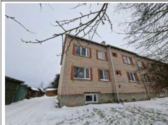
Dzīvokļa Nr.12 logi