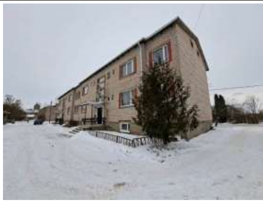
Dzīvojamā māja Stacijas ielā 16