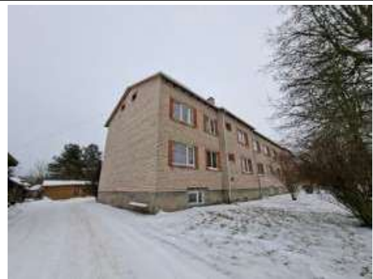
Dzīvojamā māja Stacijas ielā 16